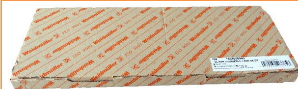
Abb.1: neue Verpackung